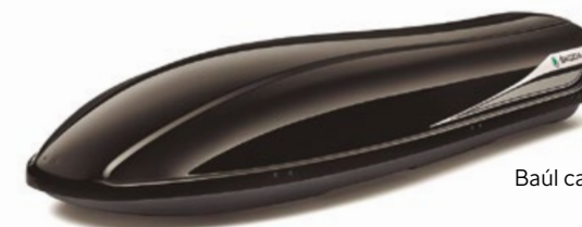
Baúl capacidad 380l.

Gama de accesorios de transporte de uso común con las barras portantes transversales. Elige el color que más te guste: negro, blanco o plateado.